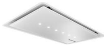
Serie | 8 Extractor de techo 90 cm cristal blanco