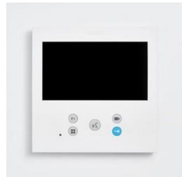
Videoportero de la casa FERMAX o silimar