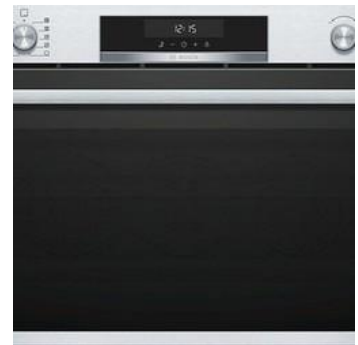
Serie | 6 Horno 90x60cm acero inoxidable