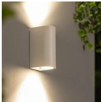
Aplique exterior de diseño (ejemplo foto)