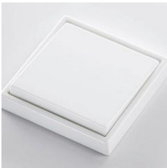
Mecanismos JUNG LS 990 blanco alpino

Se dejará en todas las estancias elegidas toma de TV y datos.